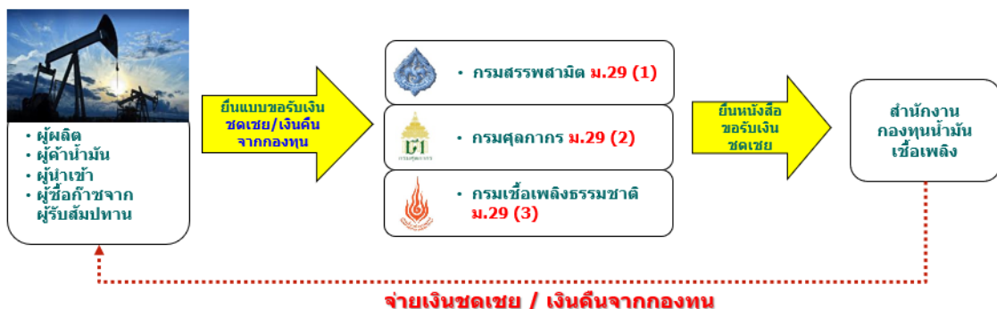
ภาพขั้นตอนการยื่นขอรับเงินชดเชย