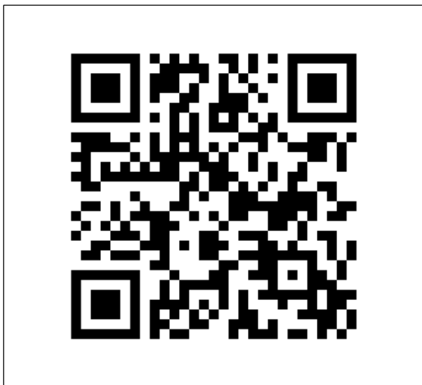
QR Code สำหรับร้องเรียนเรื่องทั่วไปและจัดซื้อจัดจ้าง